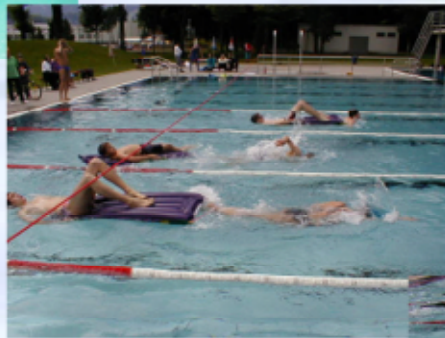
Retten mit der Luftmatratze